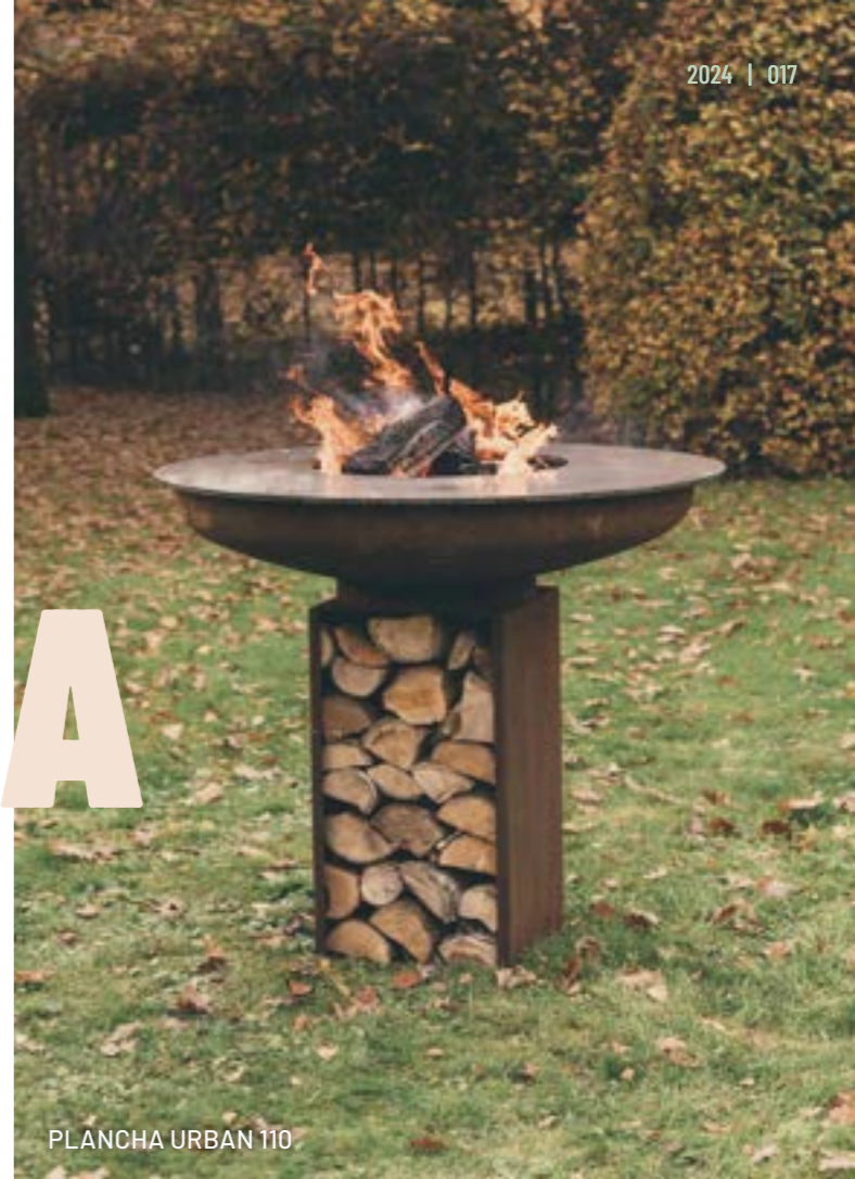
PLANCHA URBAN 110