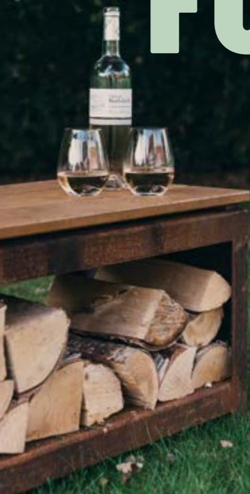
BENCH C 180

Ontdek het volledige aanbod op www.outr.be